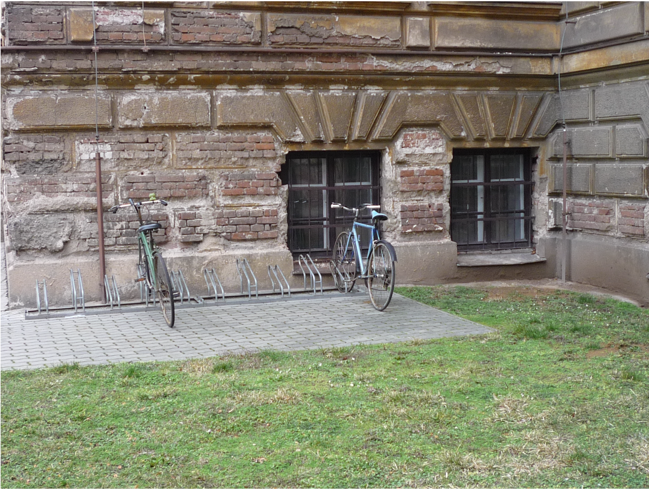
POHLED NA POŠKOZENOU SOKLOVOU ČÁST GAYEROVY KASÁRNY