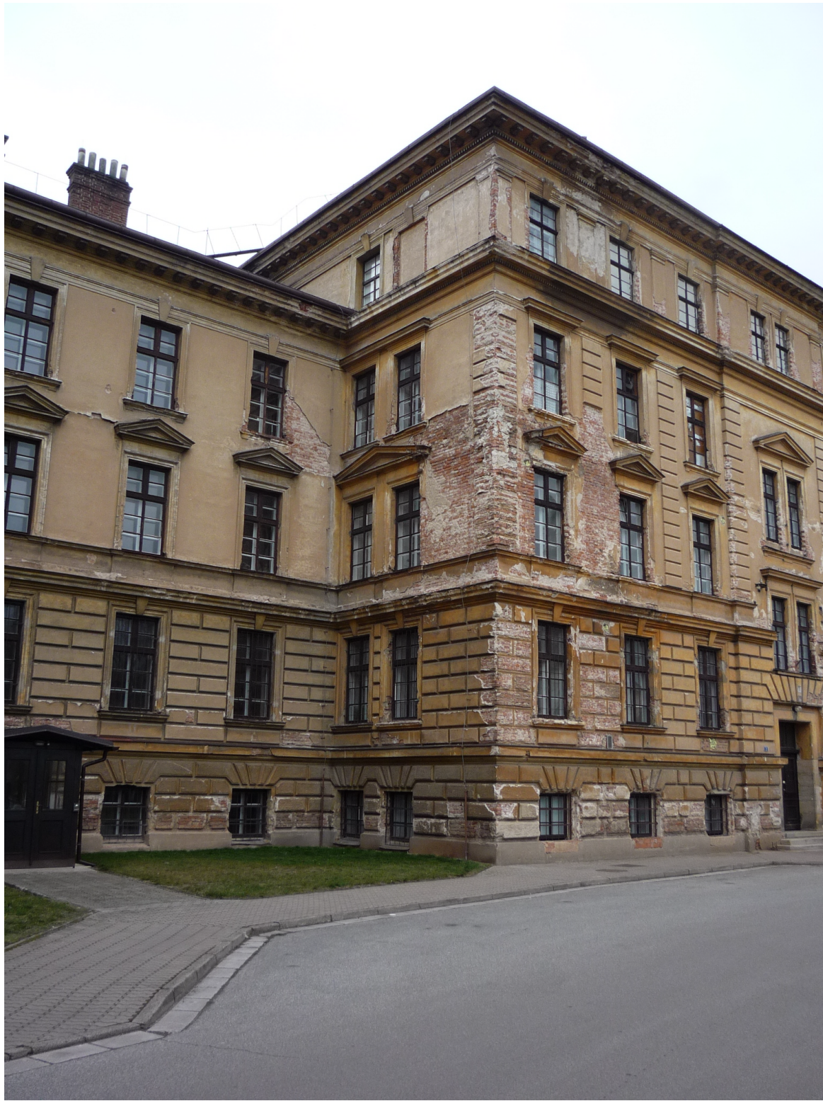
POHLED NA POŠKOZENÝ RIZALIT GAYEROVY KASÁRNY