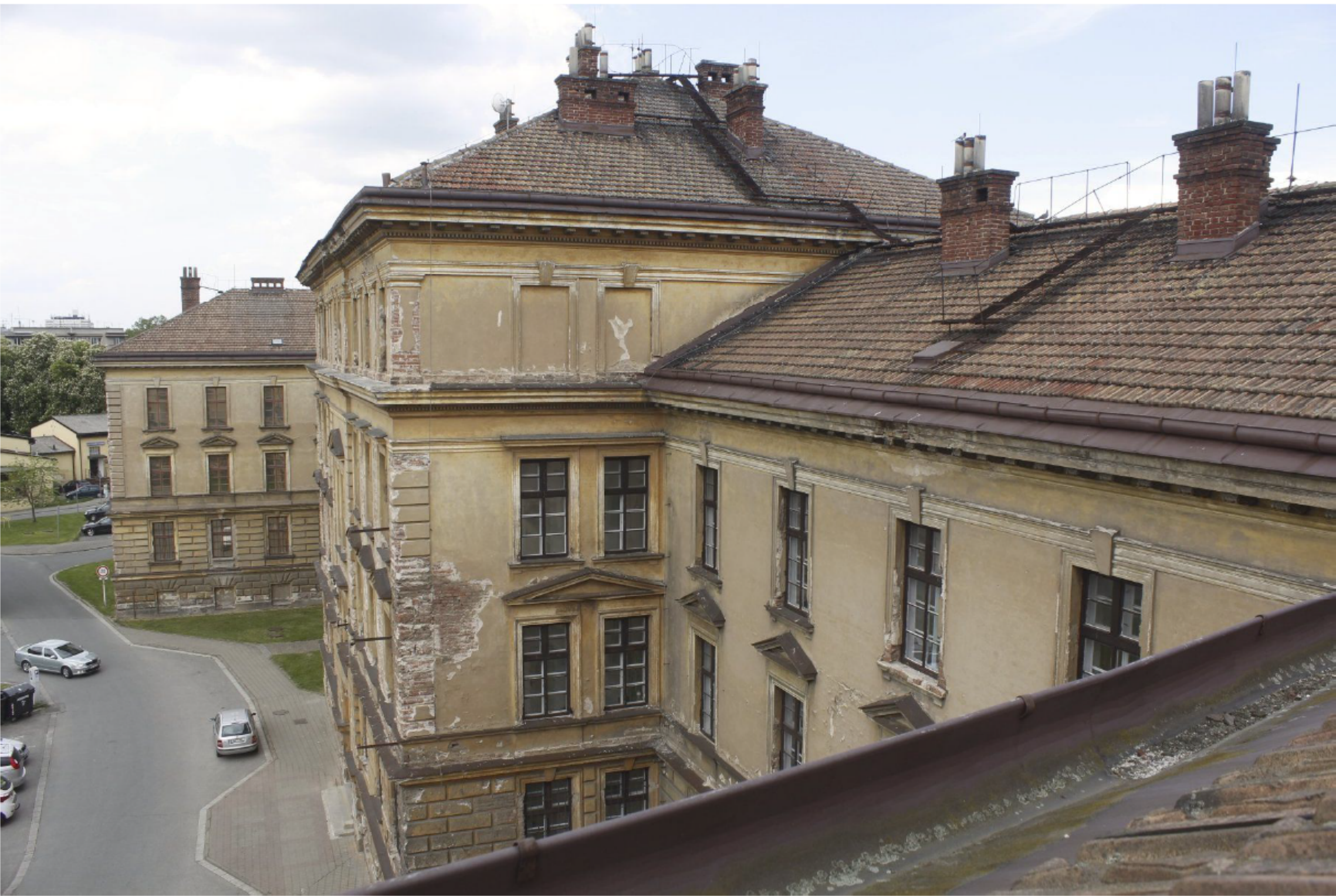
POHLED NA STŘECHY Z PRAVÉHO KŘÍDLA GAYEROVY KASÁRNY PO REKONSTRUKCI KROVU BUDE STÁVAJÍCÍ STŘEŠNÍ KRYTINA NAHAZENA NOVOU KRYTINOU STEJNÉHO TYPU