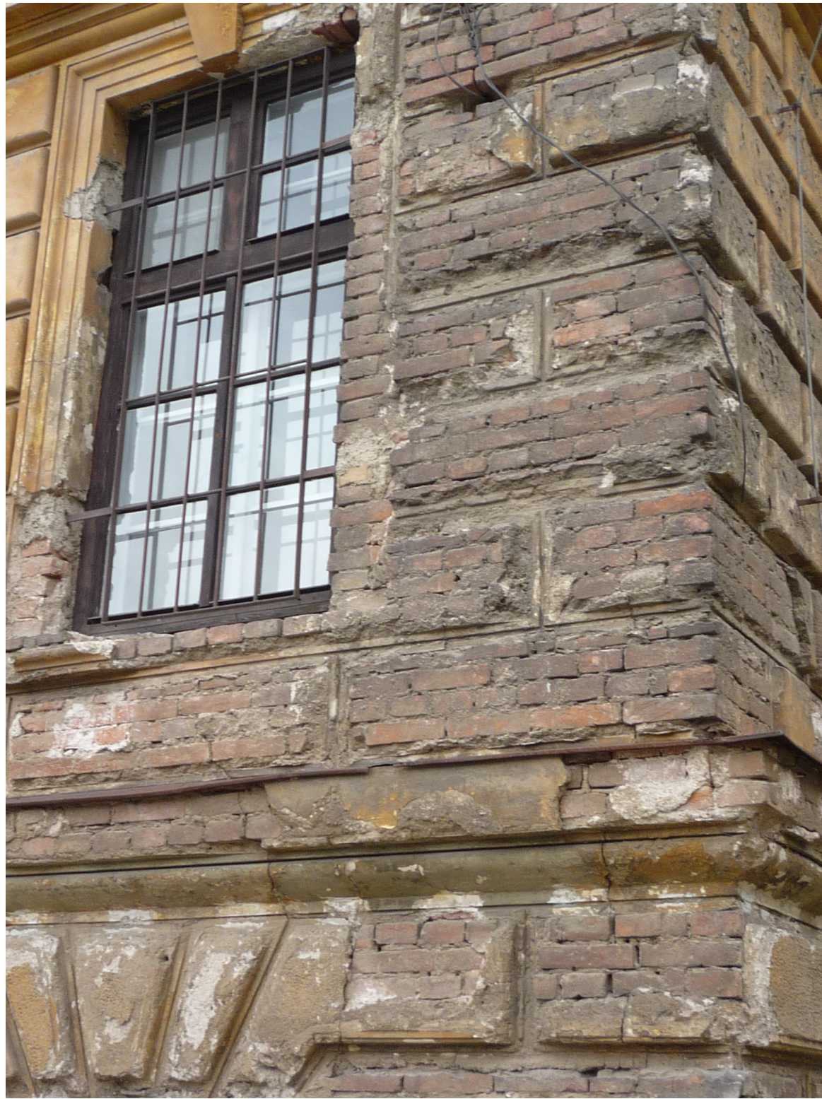
ZNÁČNÉ POŠKOZENÉ NÁROŽÍ ČÁSTI RIZALITU GAYEROVY KASÁRNY